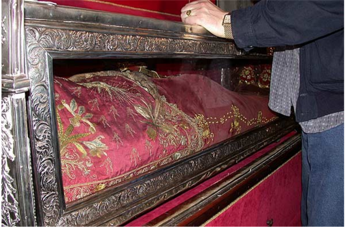
Нетленные мощи св. Феодоры (о. Корфу, Греция).