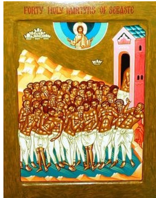
40 Holy Martyrs of Sebaste

It was winter, and there was a severe frost. They lined up the holy soldiers, threw them into a lake near the city, and set a guard to prevent them from coming out of the water. In order to break the will of the martyrs, a warm bath-house was set up on the shore. During the first hour of the night, when the cold had become unbearable, one of the soldiers made a dash for the bath-house, but no sooner had he stepped over the threshold, than he fell down dead.