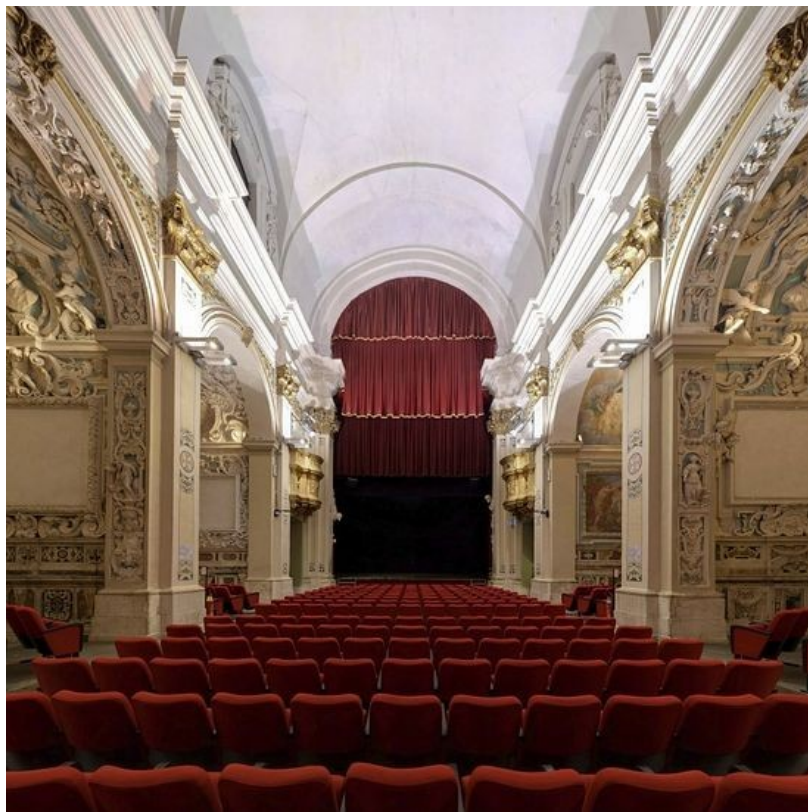
Кресла красного бархата под изображениями ангелов. Сегодня церковь Сан Фелипо в Аквиле – театр. Когда не хватает денег на реставрацию церквей, в Италии их продают в частную собственность

комфорте. Неудобно ехать в школу еще раз после обеда! Раз в неделю! Действительно, зачем? Дети должны ходить на танцы, развивать свою индивидуальность. А Закон Божий зачем?