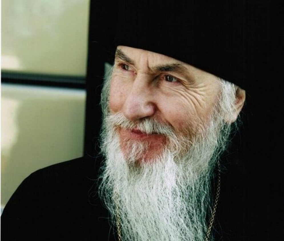
Архиепископ Берлинский и Германский Марк (Арндт).

– На мой взгляд, свобода – это такие условия, в которых я могу служить Богу и не преклоняться ни перед каким кумиром. Все страсти – это кумиры. Человек очень быстро попадает в какую-то зависимость. Но особенно страшно, когда он преклоняется перед Ваалом.