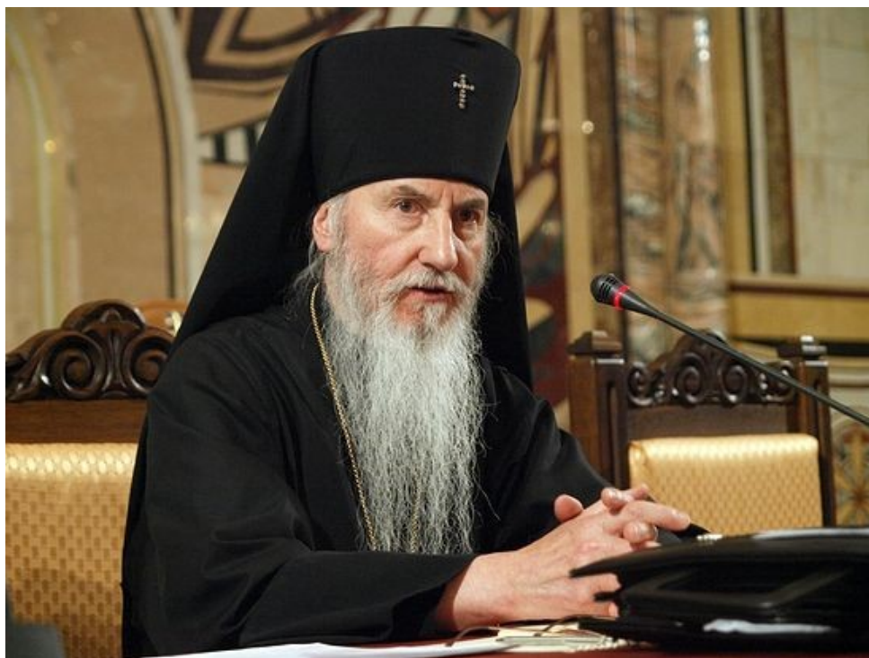
Архиепископ Берлинский и Германский Марк (Ардт).

другим путем, и чем это кончится, трудно сказать, но во всяком случае – это огромная опасность.